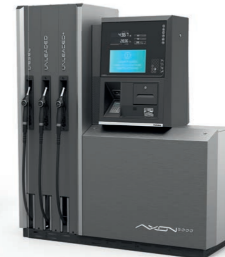
Całkowite zwijanie węży

Dystrybutor z największymi możliwościami przystosowania dla potrzeb klienta w całej linii AXON, możliwość dystrybucji do 5 produktów i 10 węży w tym LPG i AdBlue*, dostępne są także opcje medialne i płatnicze.