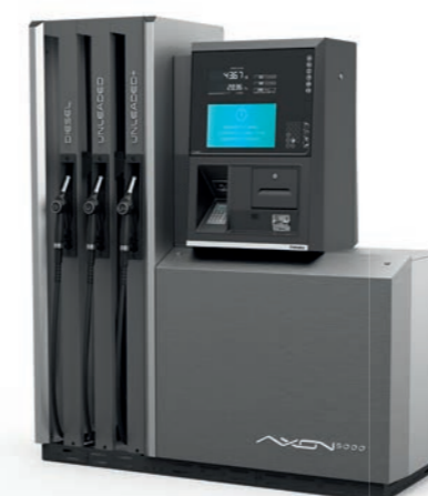
Częściowe zwijanie węży