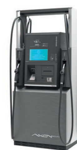
Do 4 węży

A4000 jest właściwym wyborem dla poszukujących pełni możliwości i wielowariantowej konfiguracji.