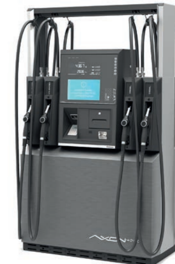
Do 8 węży